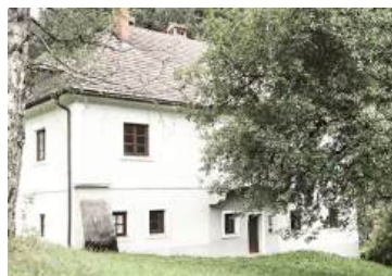
Pauschale f. Appartement bis 3. Personen € 120,-- jede weitere Person € 15,-- Frühstück auf Anfrage

Forstgut Walcheben Schwarzois 39, Ybbsitz Buchbar unter www.huettenland.at .