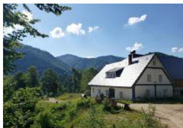
1 Ferienhaus Buchbar und weitere Infos unter www.huettenland.at