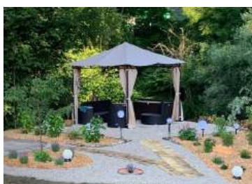
8 Stellplätze gesamt