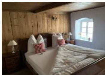
1 DZ + 1 Bett 1 DZ 2 EZ www.huettenland.at